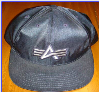
Cappellini Vintage Made in USA, scegli il modello